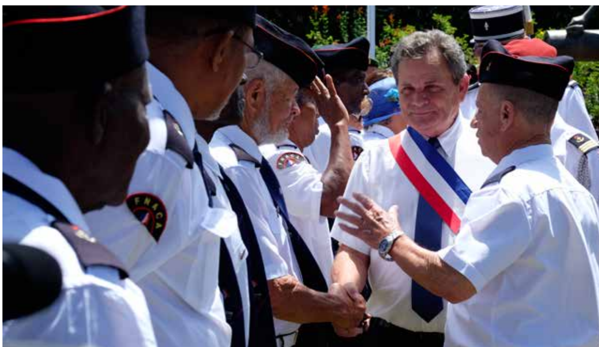
La cérémonie de commémoration de l'armistice du 11 novembre 1918 s'est déroulée devant le monument aux morts place de la mairie. Après les discours officiels, les enfants de l'école Paul Hermann ont chanté l'hymne national.